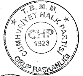
Dr. M. Sezgin TANRIKULU İstanbul milletvekili