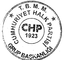
Özgür ÖZEL Manisa Milletvekili